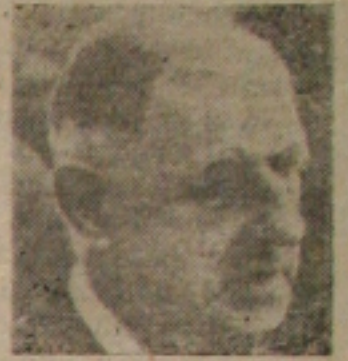
Charles De Gaulle

"Isso significa, esclareceu, que não se deve permitir qualquer intervenção estrangeira no Vietnam do Sul, Vietnam do Norte, Laos ou Camboja".