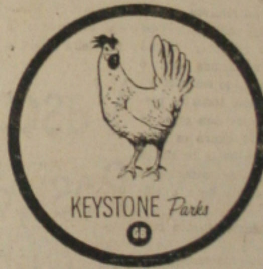
Campeoníssima na Pensilvânia (USA) e no Brasil