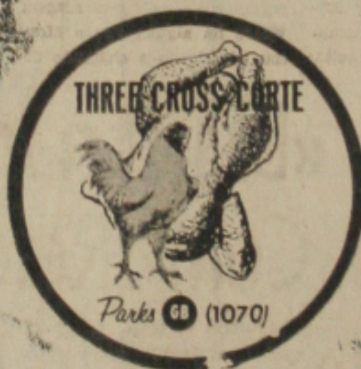
O melhor pinto de corte do Brasil