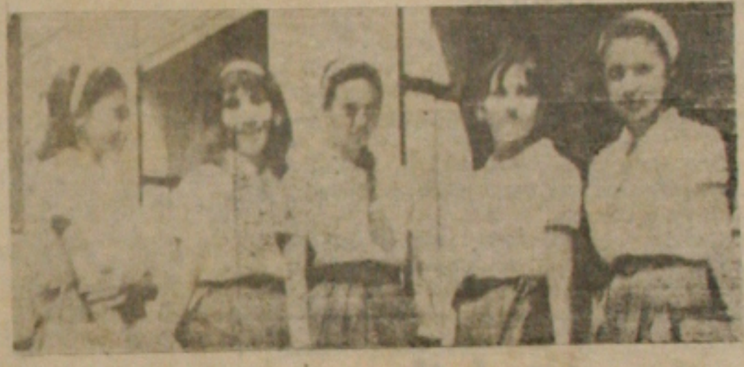
— Sendo um espetáculo de Inverno, realizado no Hotel Palace, com a participação de artistas locais e estrangeiros. O baile de Inverno, realizado no Hotel Palace, contou com a participação de artistas locais e estrangeiros.

VENDE-SE Geladeira Comercial sem- hova 1.000 quilos de capacidade. Util para todos os fins. A tratar Travessa Silva Ribeiro, 52