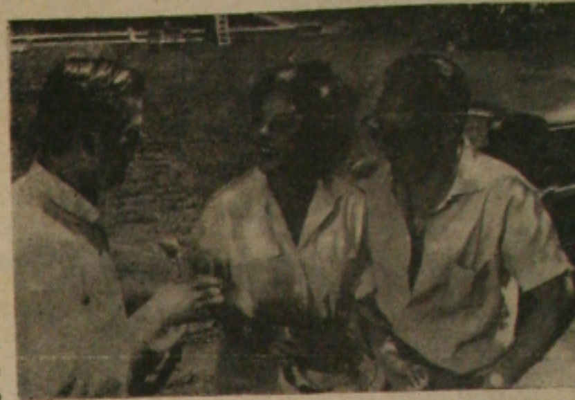
Tres Construções em um só filme: PÃO DE AÇUCAR