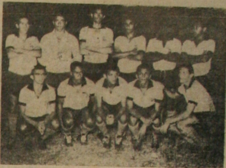
— O Confiança terá esta tarde, um dos mais difíceis compromissos pela Taça Brasil. Esta tarde, no Estádio Getúlio Vargas, na Capital alencarense, estará dando combate a valente equipe do Ceará Sporting (foto).